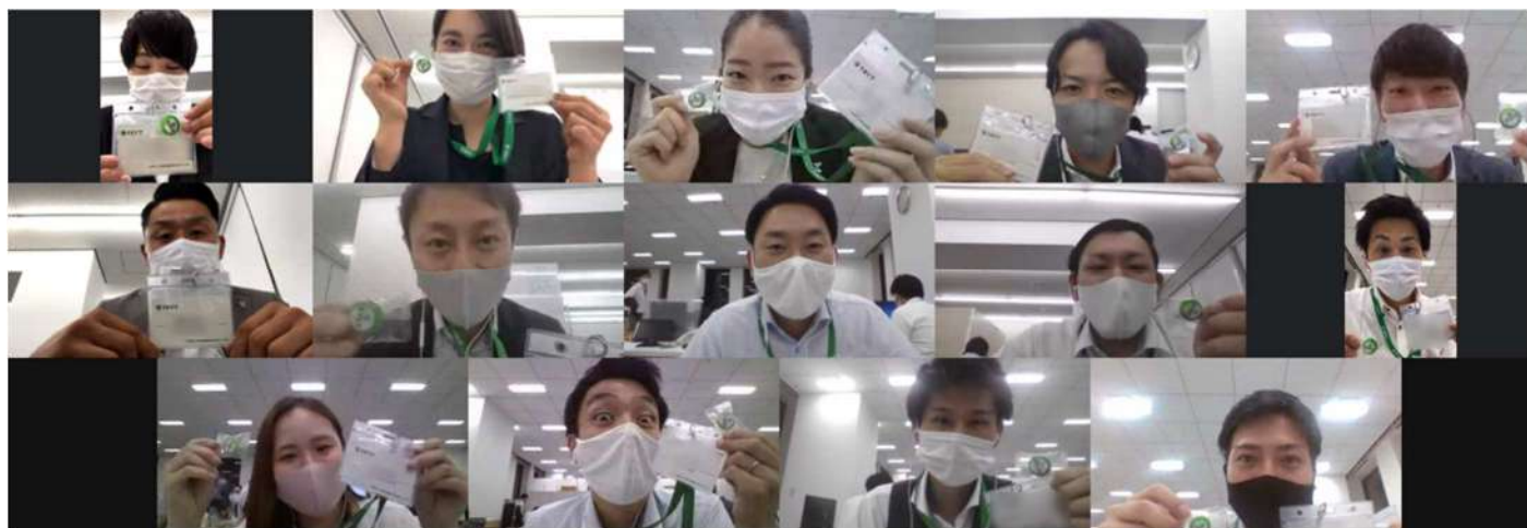
▲社名変更時に撮影した営業所の記念集合写真

その一環として、社内外に対して当社の掲げるミッション・ビジョン・バリュー（以後、MVV）に共感し、行動するきっかけに繋げる企画、「トライトフェスティバル」を実施してきましたが、約半年後の当社の管理職向けアンケートでは、128名中約70%が「自分の部署でMVVが浸透していると思う」と回答する結果になりました。