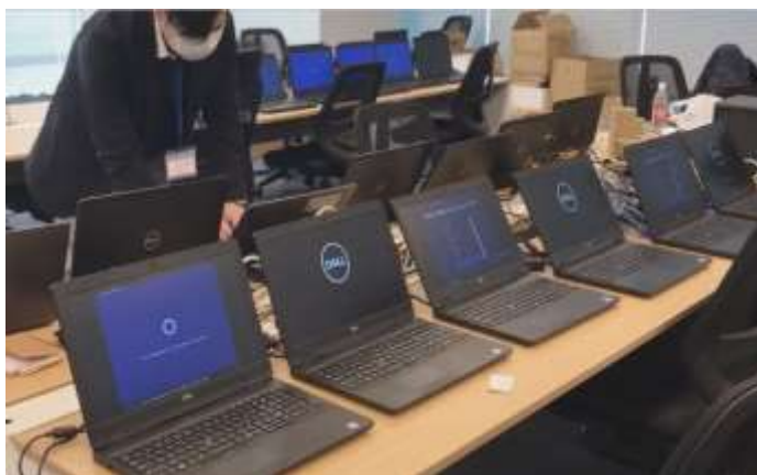
▲テレワークに向け PC のセットアップ準備を進める様子

・4 月の緊急事態宣言発令から 2 か月間、全社員がテレワークに移行した。宣言解除後は段階的な出勤緩和を行いながら、小さい子供がいるなどの不安な社員に関してはテレワークでの勤務を推奨しており、コーポレート部門に関しては現在も在宅勤務とオフィス勤務を合わせた勤務形態としている。