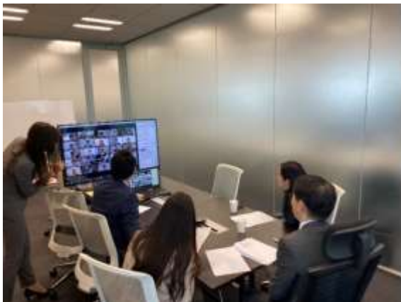
▲オンライン入社式の様子

・新型コロナウイルス感染症拡大を受け、2020 年 4 月の新入社員約 200 人の受け入れに関して、当初対面で予定していた入社式と研修をオンラインに移行するため、3 週間でオンライン用の研修プログラムを開発し、実施まで行った。研修では「成長意欲をもった新入社員の形成」をテーマに、業務に関する営業スキルや基本的なビジネススキル全般に関する e-Learning、業界知識に関する課題図書、オンライン上でのロールプレイング大会を開催した。