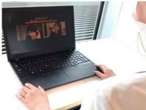
▲オンライン上のロールプレイングの様子

・在宅勤務期間においても新卒社員が一定の営業スキルを獲得できるとともに、動画 SNS 上にロールプレイング動画を投稿することで、新入社員と既存社員間のコミュニケーションの場としても活用した。 ・新入社員に対して行ったアンケート結果では、約 9 割がオンライン研修でも同期とのつながりを感じたと回答、また実践を想定したロールプレイングを取り入れたことにより満足度は約 8 割超という結果になった。