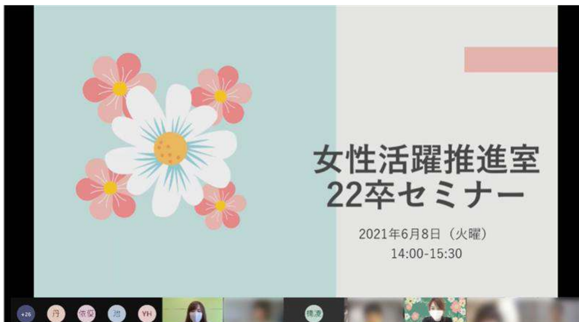
▲女性活躍推進セミナーの様子

また、20代でのキャリアアップや成長を軸に就職活動を行う学生のニーズを受けて、2022年4月に新卒入社予定の内定者に向けた「女性活躍推進22卒セミナー」を6月8日（火）にオンライン開催しました。入社前の内定者に向け、自社の女性活躍の取り組みや実態を紹介する説明会や座談会開催は国内では新しい取り組みです。